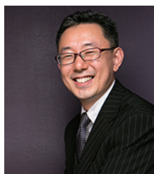
講師 株式会社クライス&カンパニー シニアヴァイスプレジデント